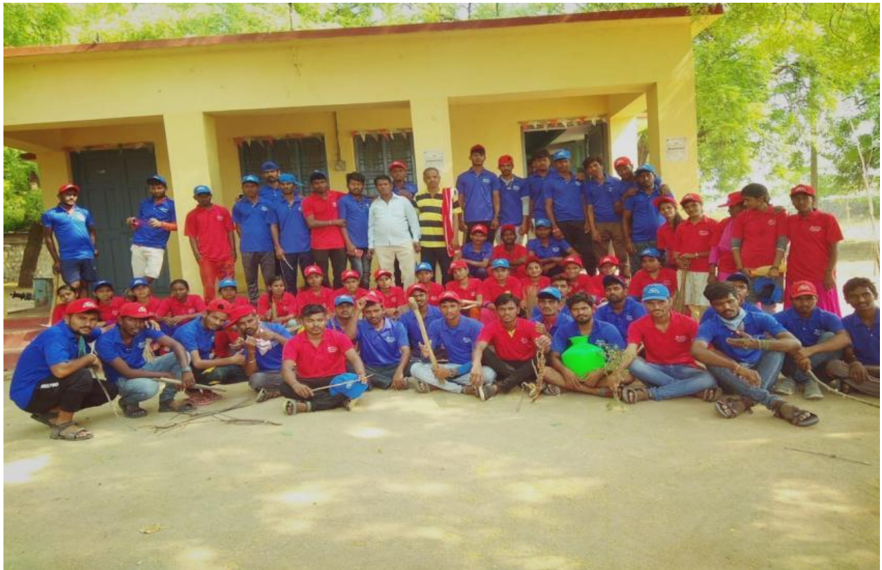
Our College N.S.S. Students cleaned nearby Village Gabbur in Association with Youth Committee Gabbur.